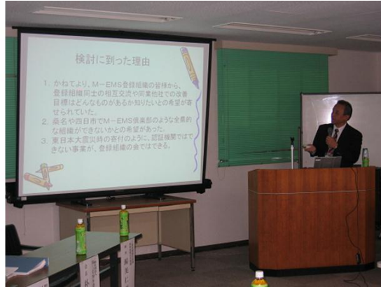
10. M-EMS環境倶楽部の説明